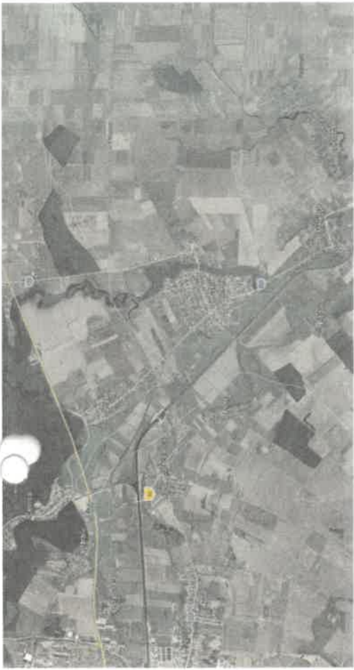
Vezi ANEXA 2 - Plan de situatie iluminat public