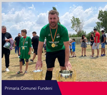
Primaria Comunei Fundeni